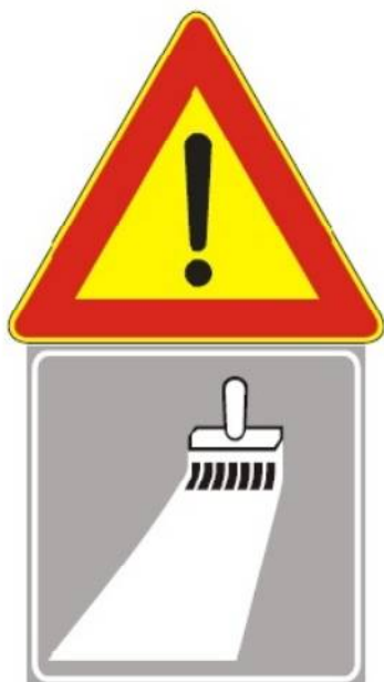
Figura II 391 Art. 31