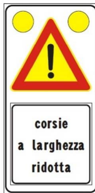
Figura II 391c Art. 31